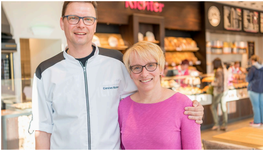
180601_richter1.jpg - © Denvers Fotografie