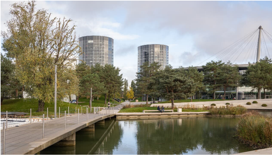
Autostadt Türme