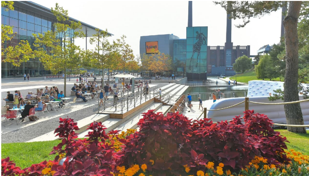
Parklandschaft Autostadt