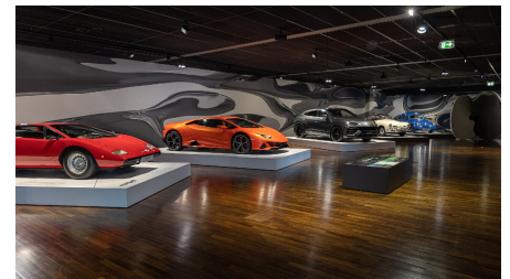
Ausstellung im ZeitHaus der Autostadt