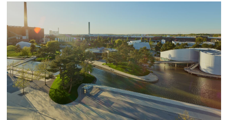
Autostadt Panorama