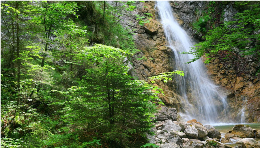
Wasserfall in der Schleifmühlklamm