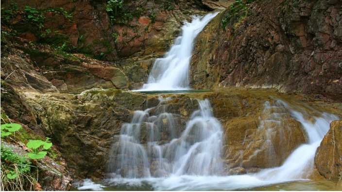
In der Schleifmühlklamm