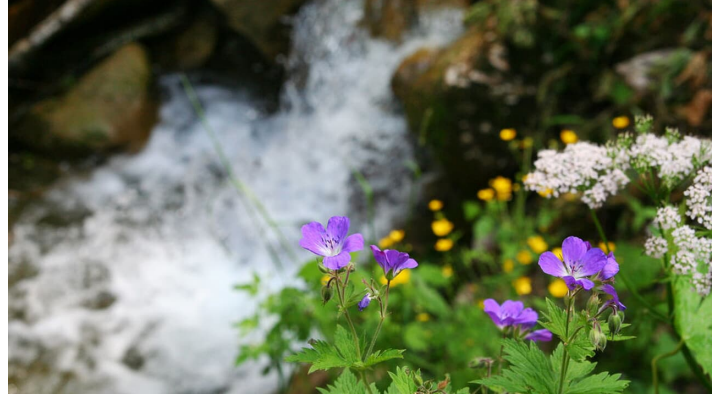
Wasserkessel Schleifmühlklamm