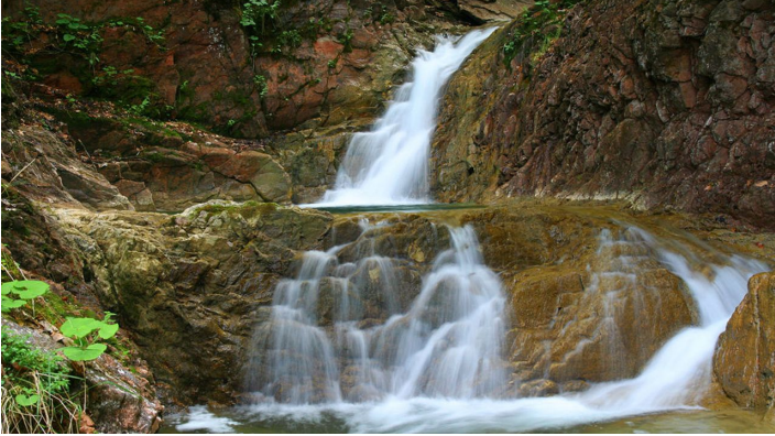
In der Schleifmühlklamm