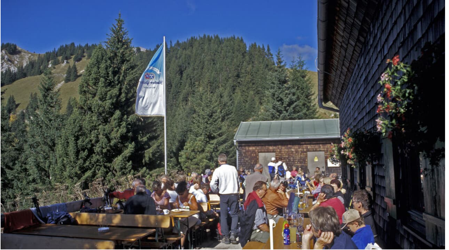
August-Schuster-Haus, Unterammergau mit Brotzeitterrasse, Aussichtsterrasse