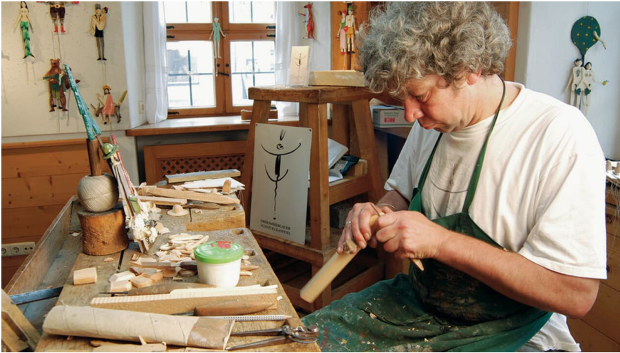
Schnitzer in der Lebenden Werkstatt