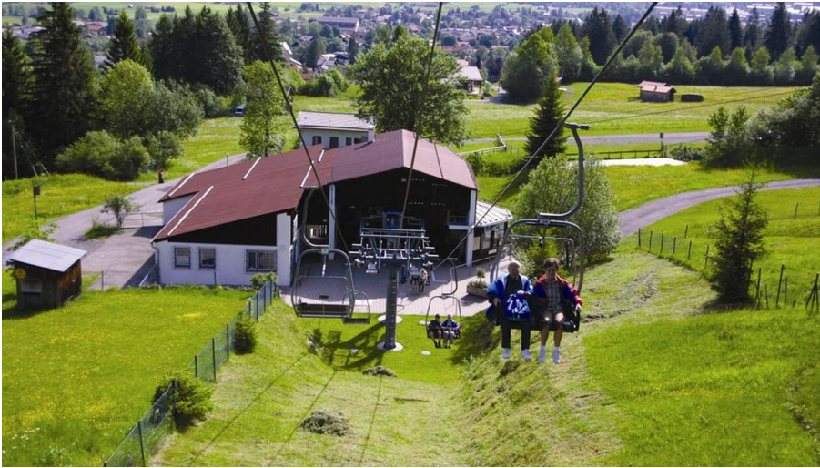
Kolbensesselbahn Oberammergau