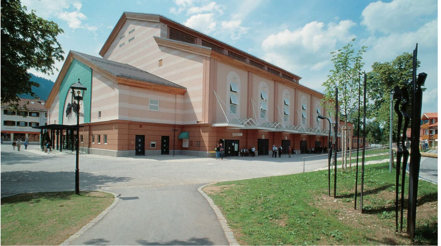
Aussenansicht Passionstheater