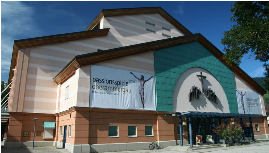
Frontseite Passionstheater - © Ammergauer Alpen GmbH, Stephan de Paly

Historische/ Archäologische Stätten Theater