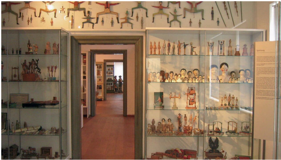
Innenraum Oberammergau Museum - © Ammergauer Alpen GmbH, Oberammergau Museum