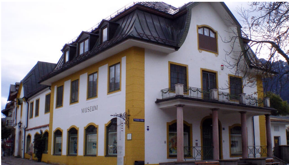
Aussenansicht Oberammergau Museum