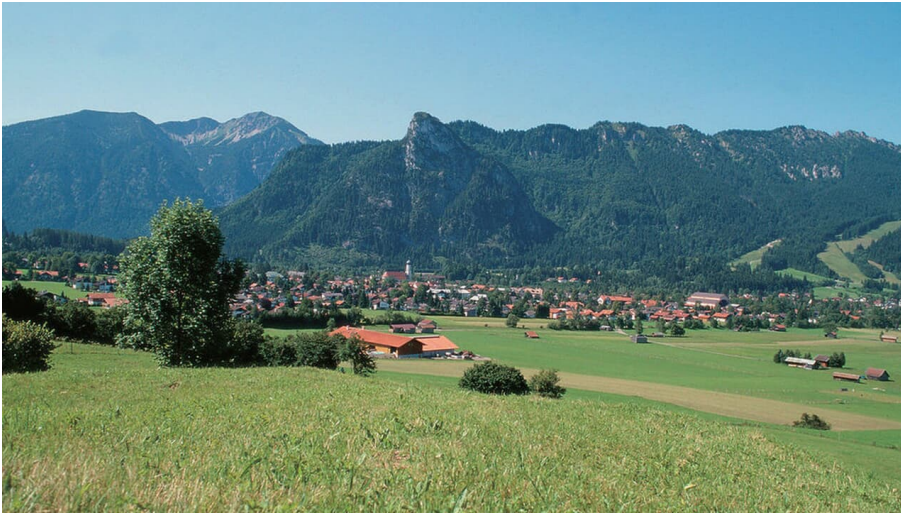
Aussicht von der Romanshöhe auf Oberammergau - © Ammergauer Alpen GmbH, Thomas Klinger