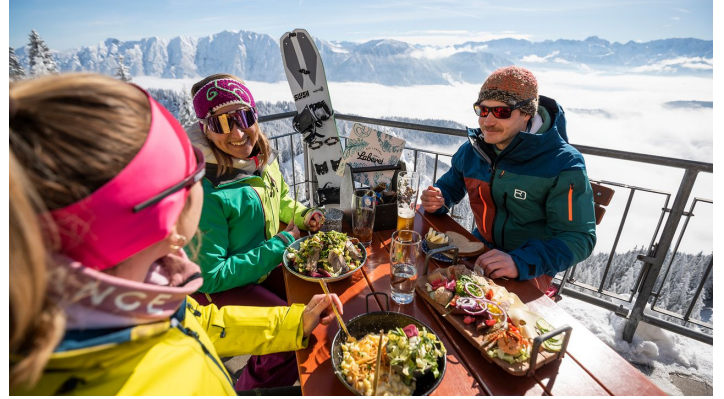
Laber Bergbahn Bergstation Winter.jpg