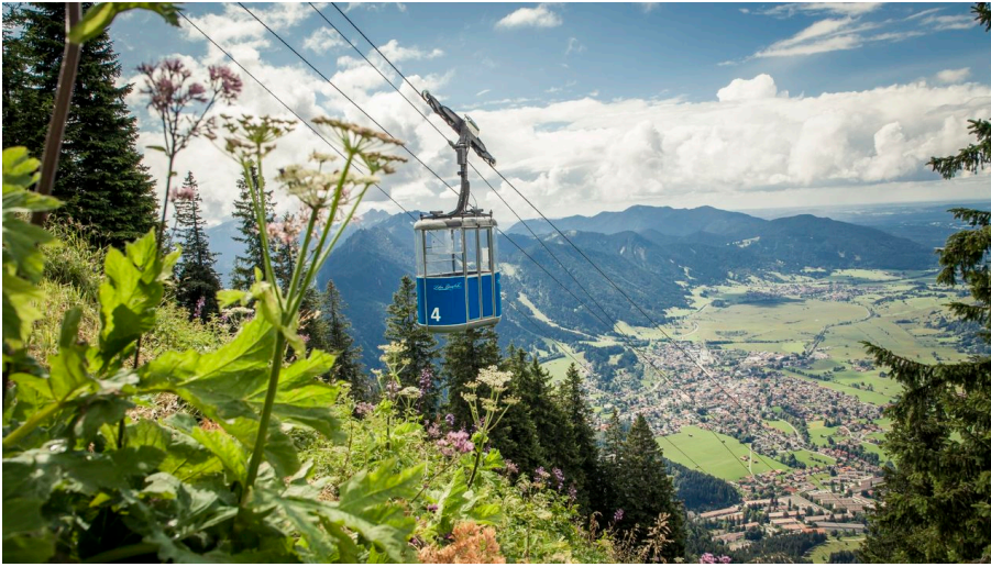
Laber Bergbahn Sommer