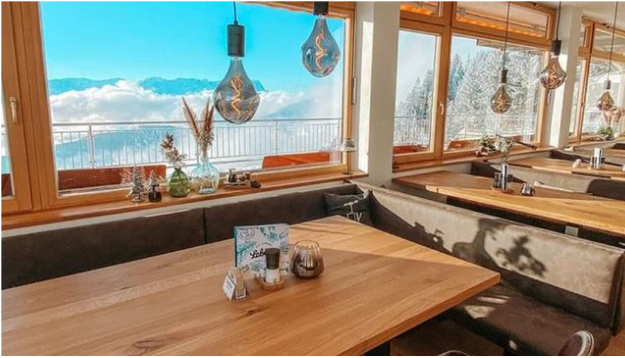
Die Laberei Innenansicht