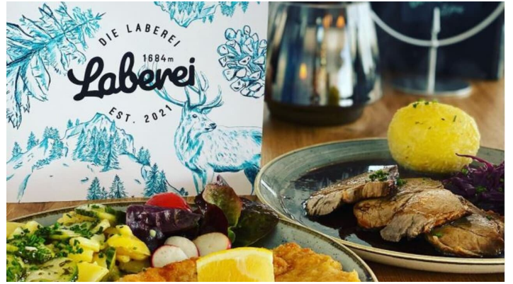
Die Laberei Speisekarte