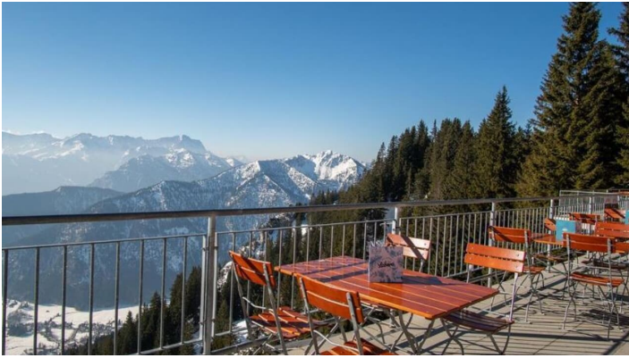
Die Laberei Blick von der Terrasse