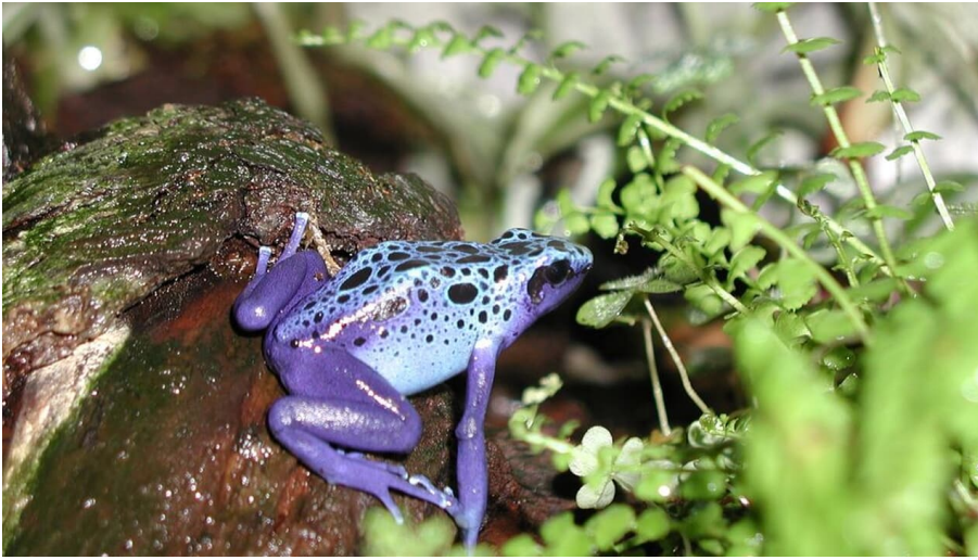
Blauer Pfeilgiftfrosch