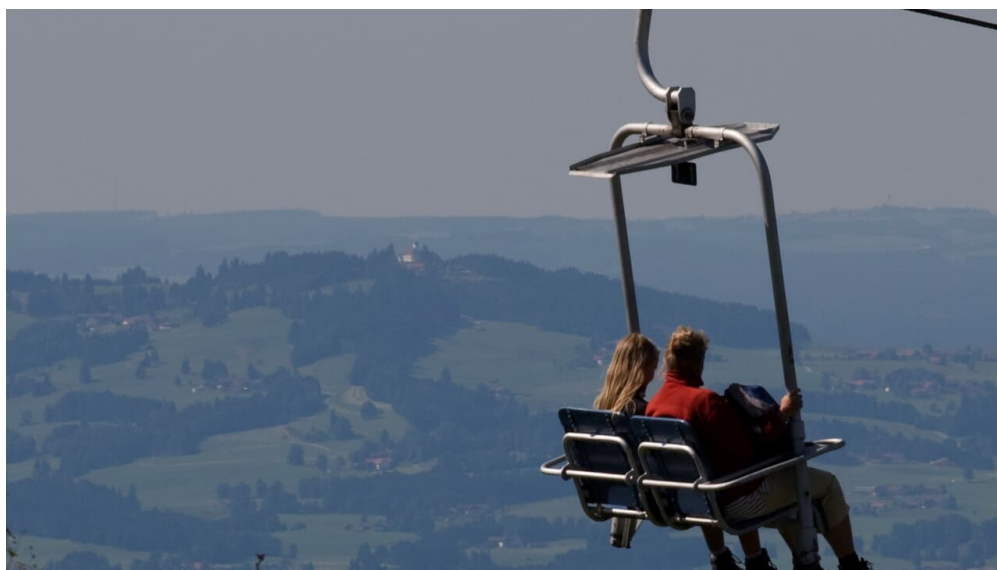
Hoernle-Schwebbahn Sessel.jpg