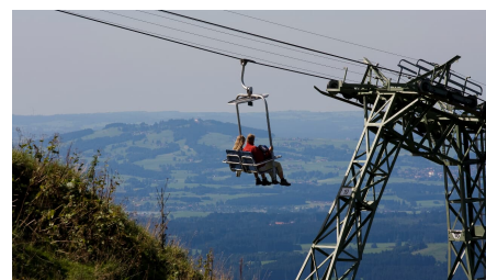
Hoernlelift mit Alpenvorland1.jpg