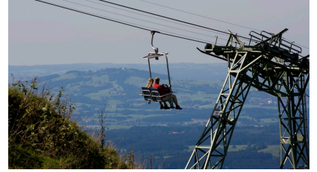
Hoernlelift mit Alpenvorland1.jpg