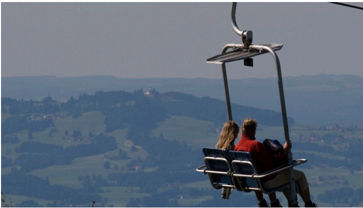
Hoernle-Schwebbahn Sessel.jpg