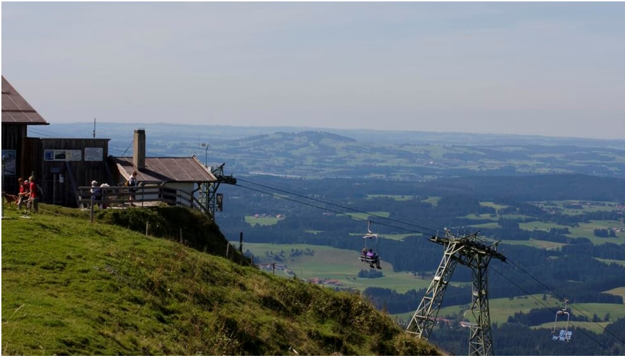
Hörnlebahn Bergstation