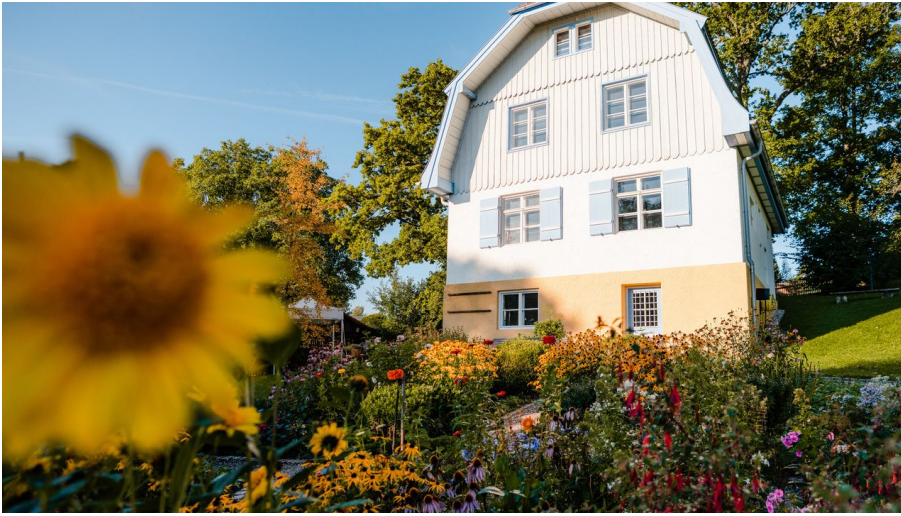
Münter Haus @Tourist-Info_klein.jpg