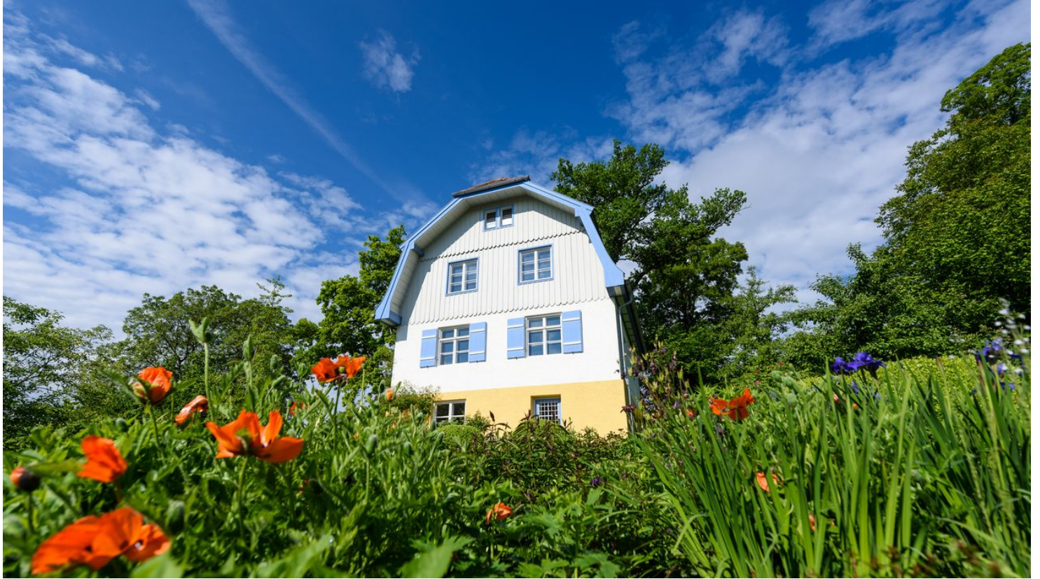
Muenter-Haus-Das-Blaue-Land-Wolfgang-Ehn-1.jpg - © go-images.com / Wolfgang Ehn, Das Blaue Land / Wolfgang Ehn