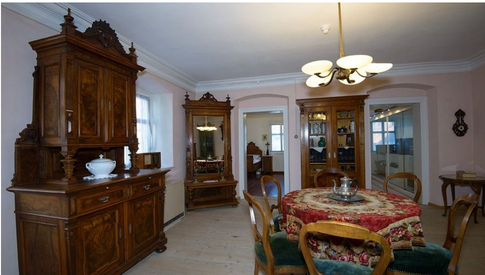
Wohnstube der Familie Bierling im Museum im Bierlinghaus

Aktuell geschlossen für Reparaturarbeiten.