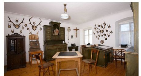
Schreibstube der Kaufmannsfamilie Bierling im Museum im Bierlinghaus