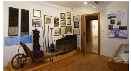
Geschichte der Moorgewinnung im Museum im Bierlinghaus