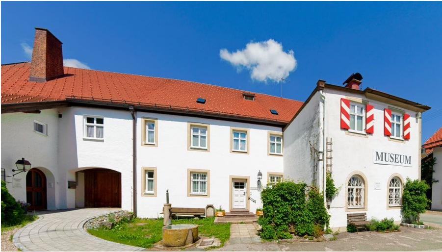
Museum im Bierlinghaus, Bad Bayersoien