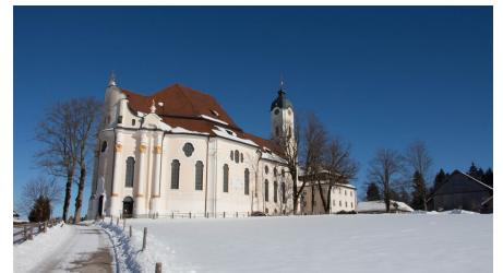
AMMERGAUER ALPEN GMBH