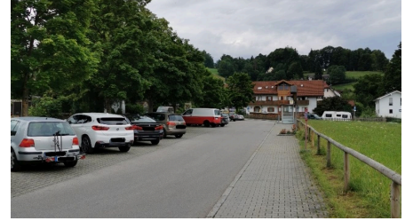
Parkplatz Erlestraße 3.jpg