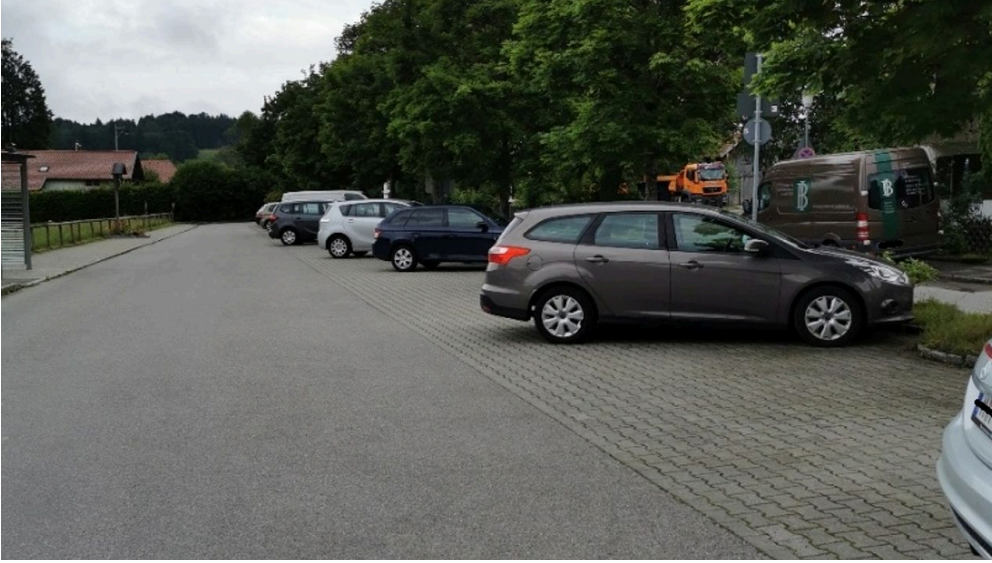
Parkplatz Erlestraße 1.jpg