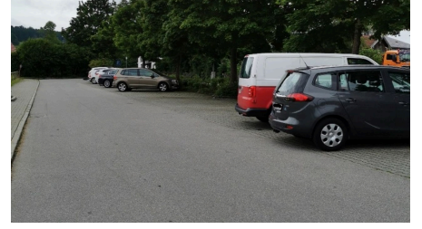
Parkplatz Erlestraße 2.jpg - © b4a98bda-80f0-443d-8e25-fd669a575309