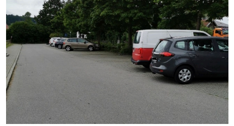
Parkplatz Erlestraße 2.jpg - © b4a98bda-80f0-443d-8e25-fd669a575309