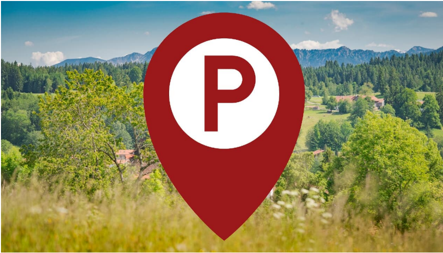
Point of Interest Parkplatz.jpg - info@ammergauer-alpen.de