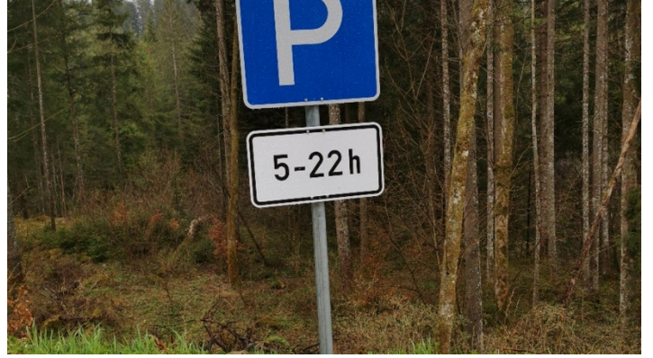
PP Kammerl Schild.jpg