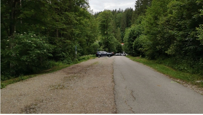
PP Kammerl.jpg