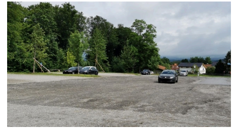
Parkplatz Tannenbankerlift 2.jpg