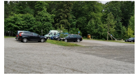
Parkplatz Tannenbankerlift 3.jpg