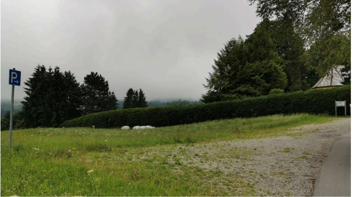
PP St. Rochus.jpg