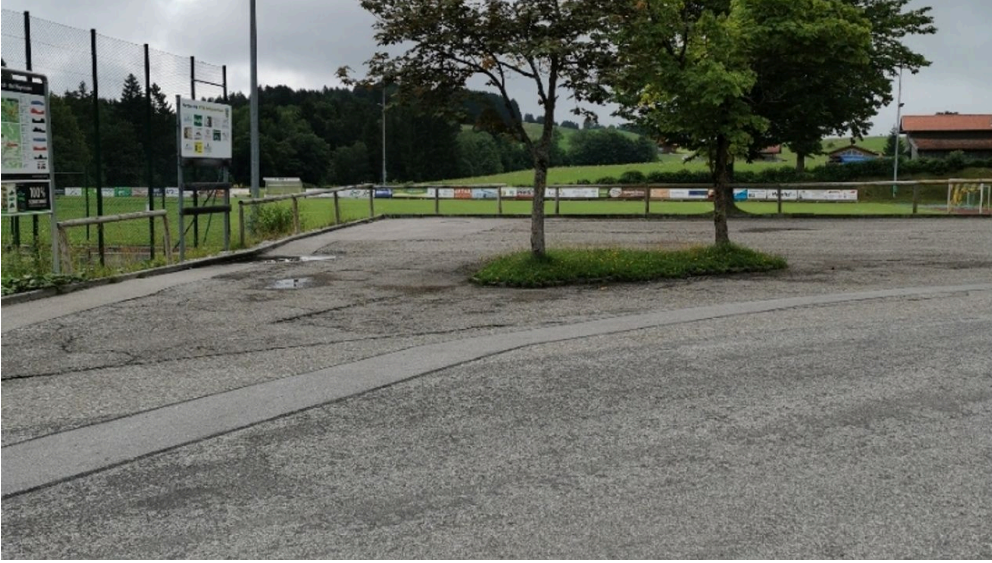
Parkplatz Sportzentrum 1.jpg