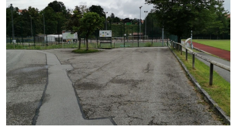
Parkplatz Sportzentrum 2.jpg