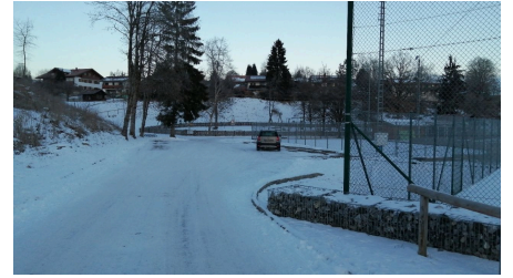
Parkplatz Sportzentrum 3.jpg