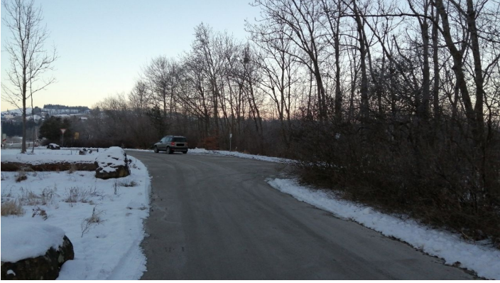
Parkplatz Kurhaus_Bahnhof 1.png