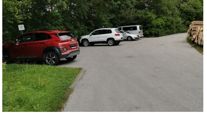
Parkplatz Kurhaus_Bahnhof 2.png