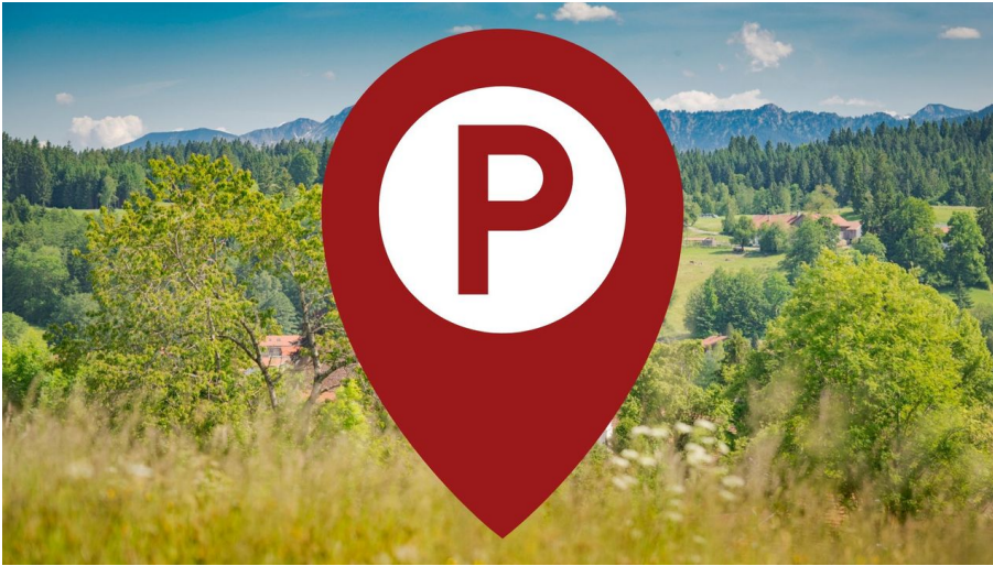
Point of Interest Parkplatz.jpg - info@ammergauer-alpen.de