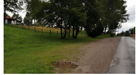
Parkplatz Friedhof Kirmesauerstraße 2.png