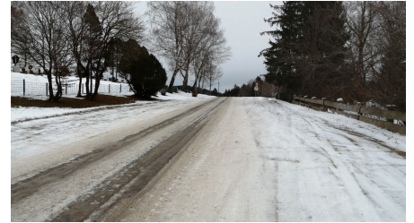
Parkplatz Friedhof Kirmesauerstraße 3.png