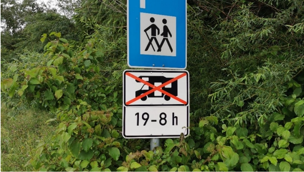
Parkplatz Friedhof Kirmesauerstraße 1.png