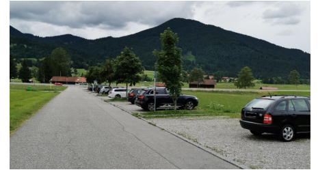
Parkplatz Kappel 3.png