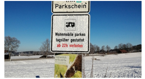
Parkplatz Kappel 2.png