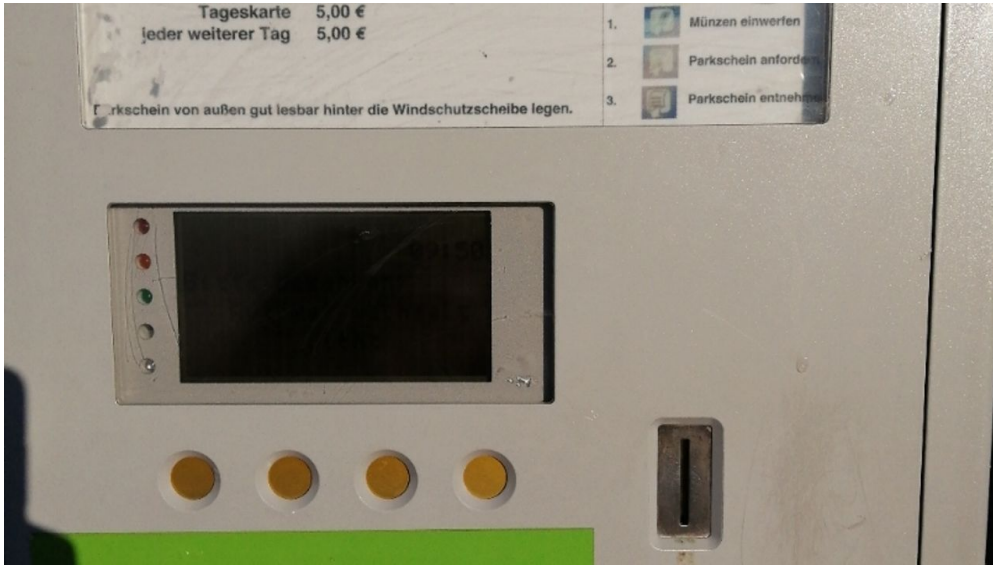
Parkplatz Kappel 1.png