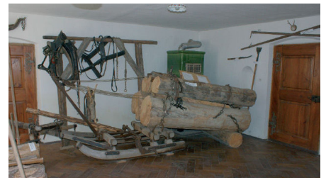
Forstwirtschaft: Baumschlitten