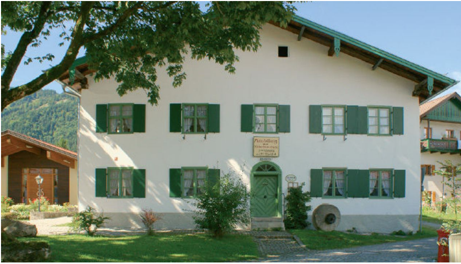
Aussenansicht Dorfmuseum Unterammergau