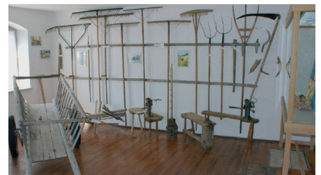
Landwirtschaft: Graskarren, landwirtschaftliche Geräte