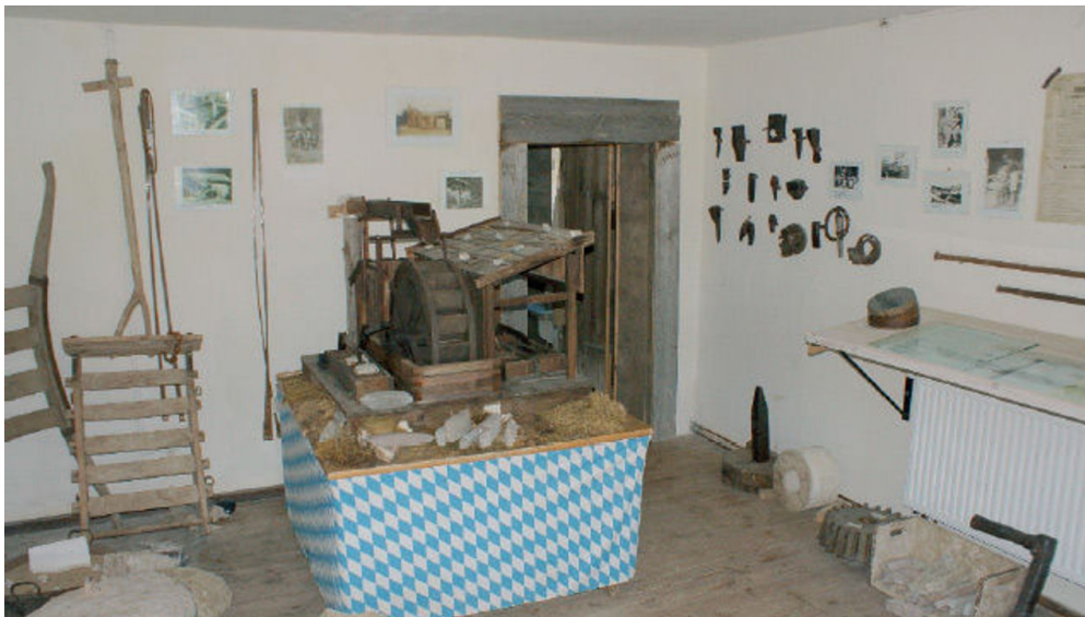
Wetzsteinmacherei mit Wetzsteinmühlenmodell

Ende Mai bis Anfang Oktober jeden Sonntag von 15:00-17:00 Uhr und nach Vereinbarung.