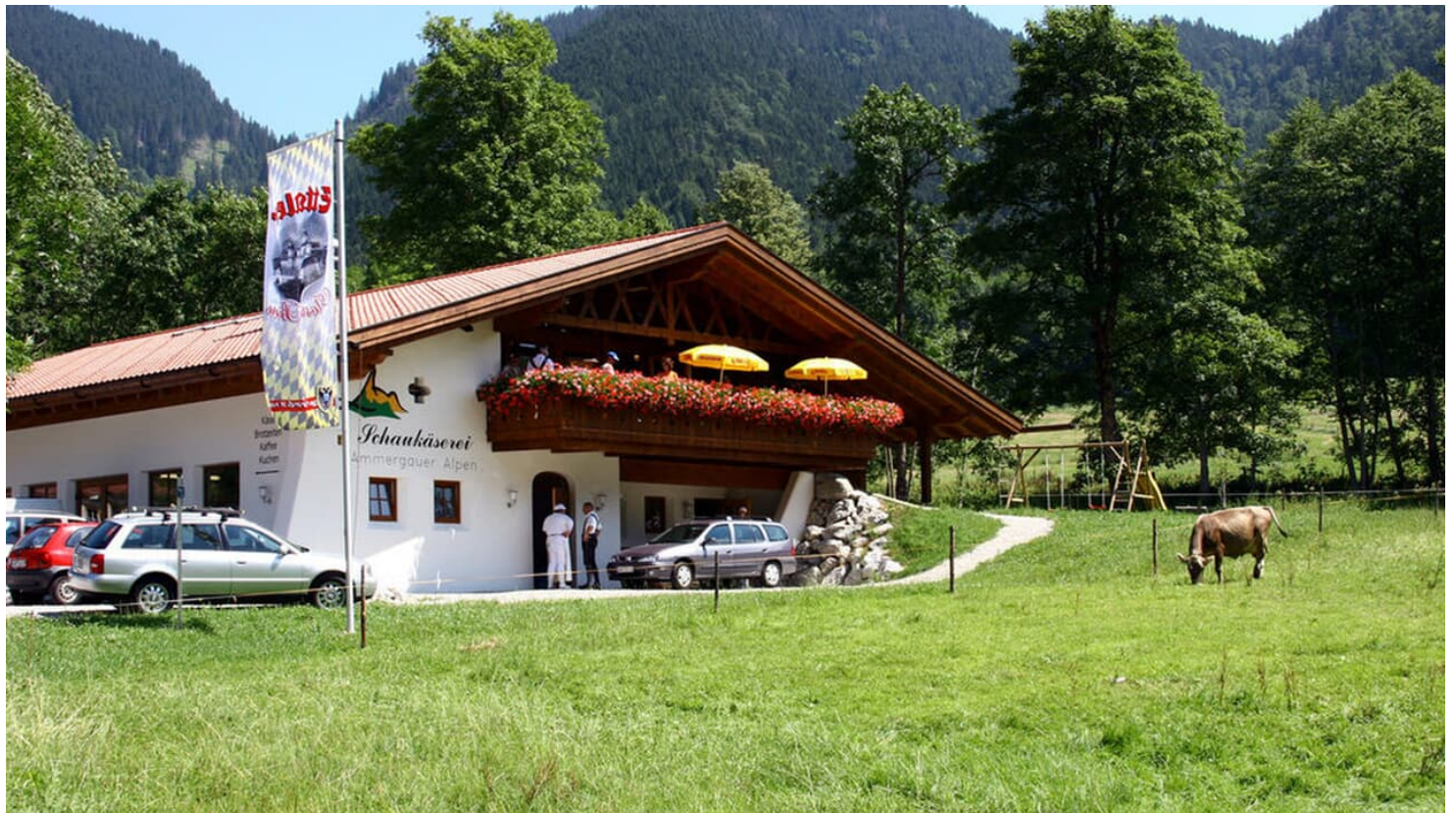
Schaukäserei Ettal