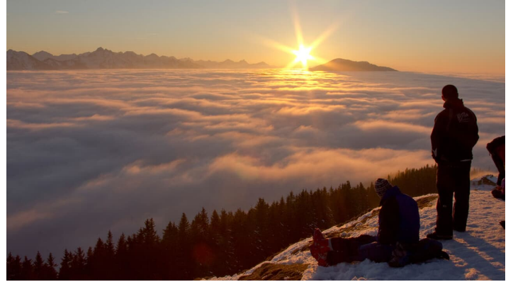
Sonnenuntergang am Hörnle im Winter