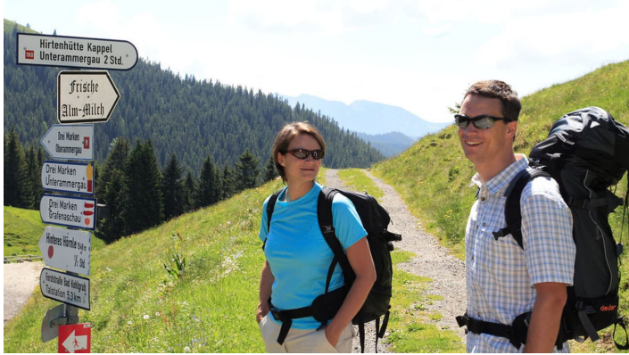
Wanderwegweiser auf dem Hörnle