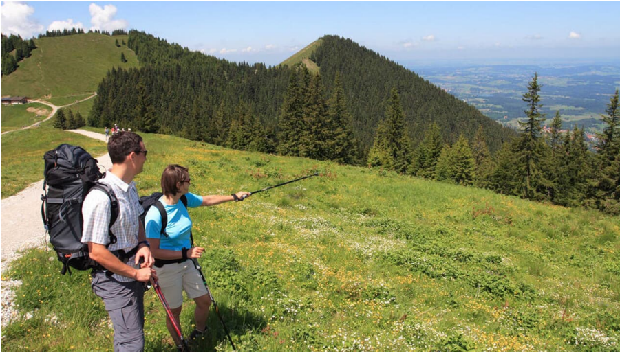
Wanderaussicht am Hörnle