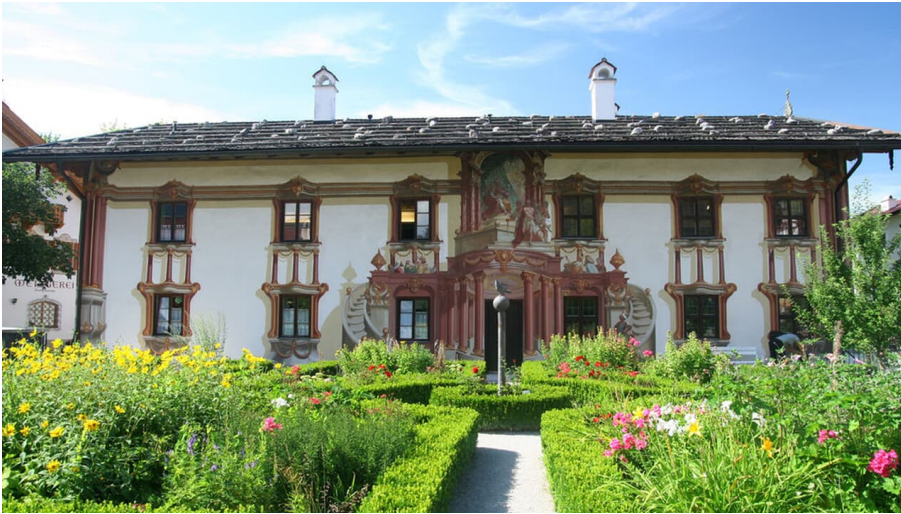
Pilatushaus im Sommer