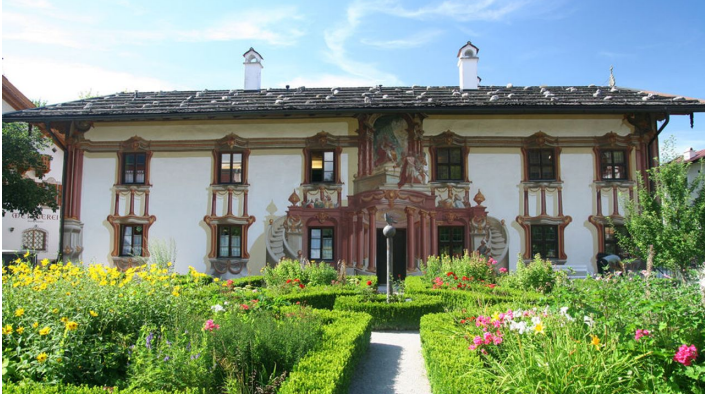
Pilatushaus im Sommer