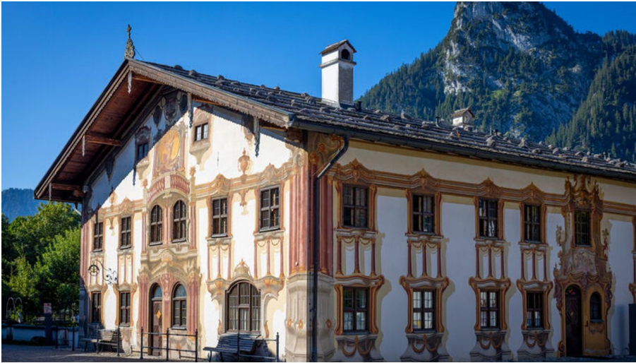
Pilatushaus(c)Ammergauer Alpen Foto Julian Leitenstorfer.jpg - © Julian Leitenstorfer