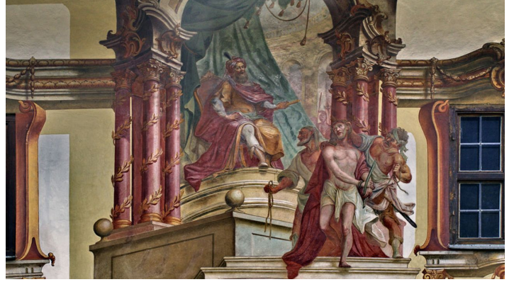
Gemälde am Pilatushaus