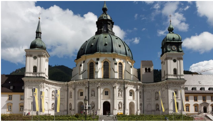
AMMERGAUER ALPEN GMBH