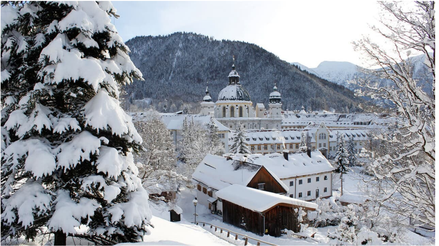
Blick auf Kloster Ettal im Winter