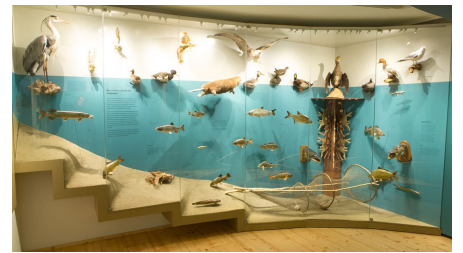
CHRISTIAN KOLB 2016