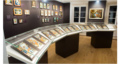
CHRISTIAN KOLB 2016