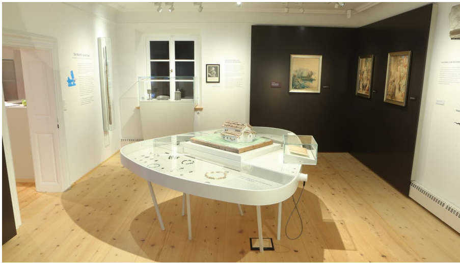
CHRISTIAN KOLB 2016