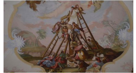
Kreuzabnahme Kappelkirche - © Ammergauer Alpen GmbH, Horst Preisenhammer