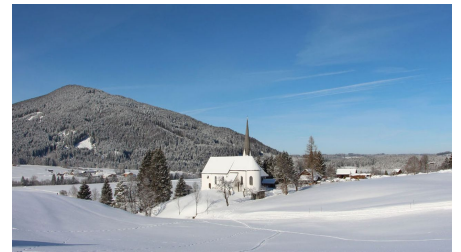
Kappelkirche im Winter