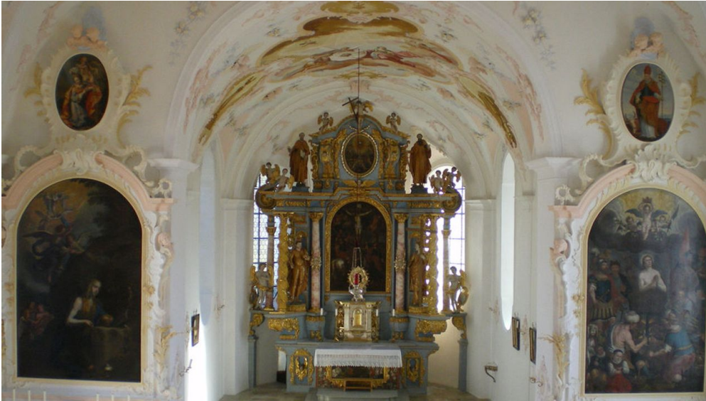
Kappelkirche Innen - Altarbild - © Ammergauer Alpen GmbH, Horst Preisenhammer