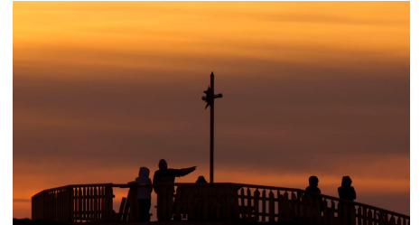
Abendstimmung auf dem Zeitberg Hörnle in Bad Kohlgrub