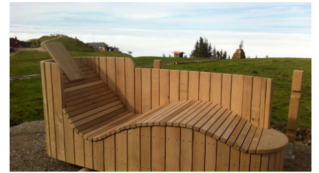
Zeitberg Moorliege zum Entspannen