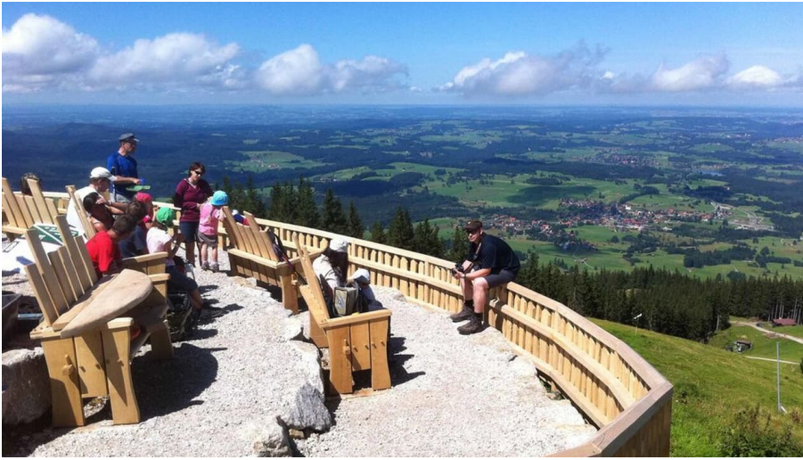
Zeitberg Natur-3D-Kino