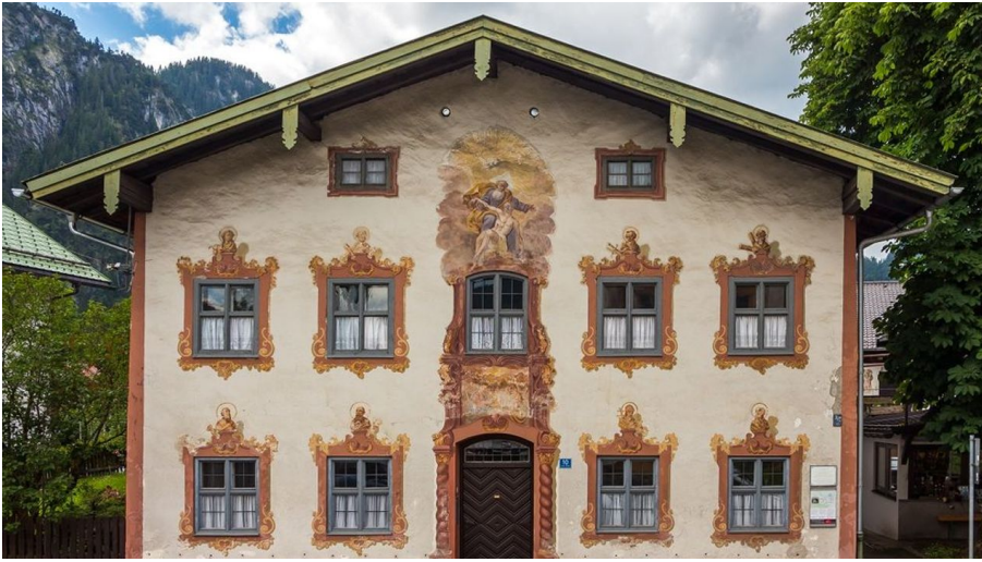
AMMERGAUER ALPEN GMBH