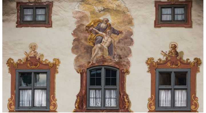
AMMERGAUER ALPEN GMBH