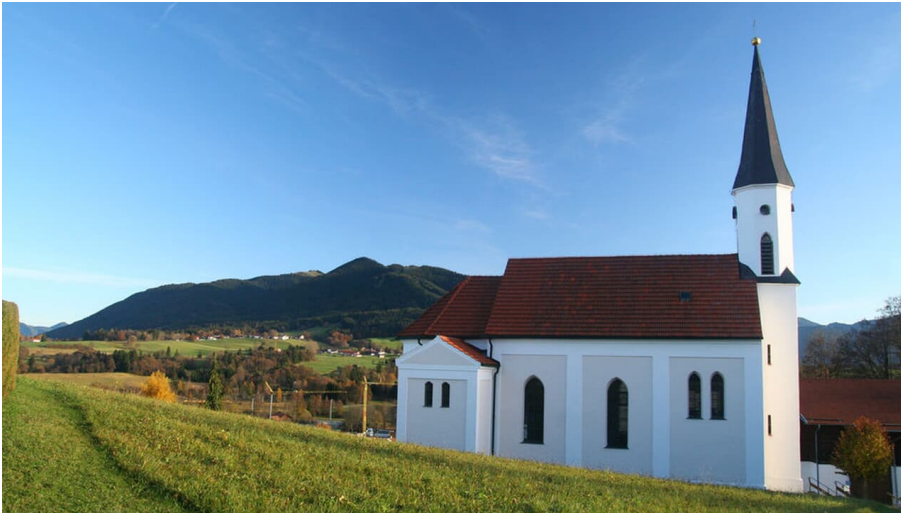
Pfarrkirche St. Franziskus von Assisi