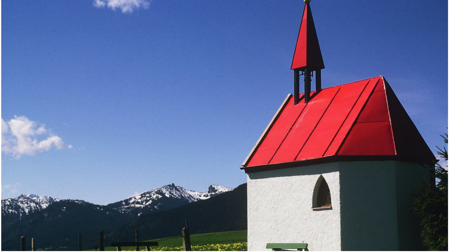
Fatima Kapelle Saulgrub - © Alois Schindler