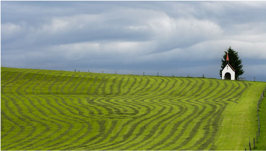
Fatimakapelle in Saulgrub