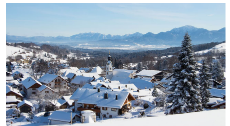
Bad Kohlgrub im Winter