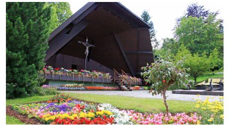
Kurpark Bad Kohlgrub