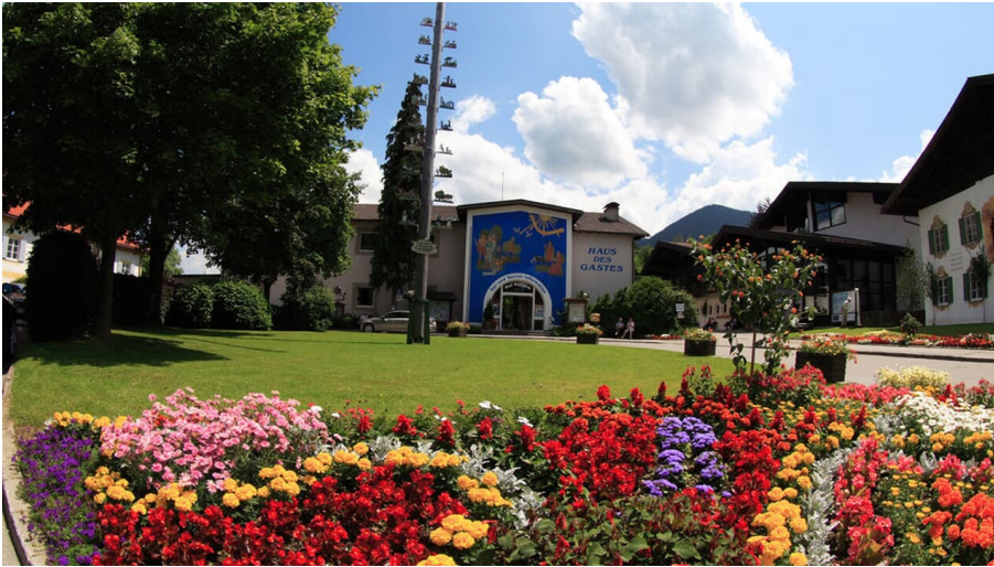
Haus des Gastes