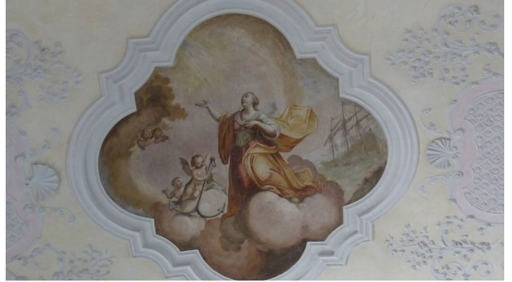
Innenfresko Pfarrkirche Bad Bayersoien