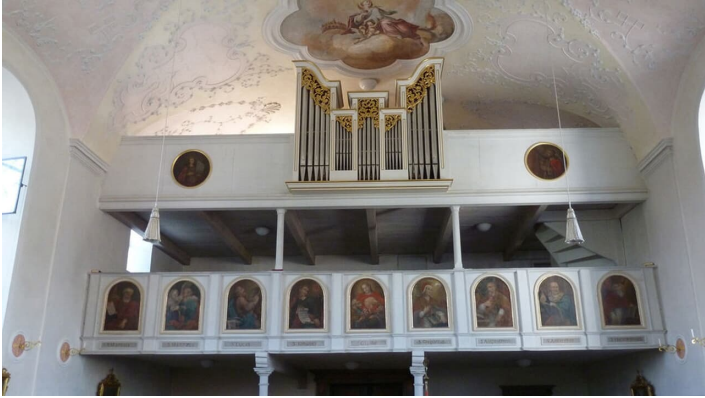
Innengestaltung Pfarrkirche St. Georg Bad Bayersoien