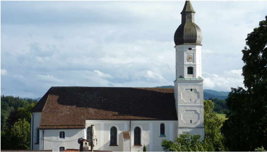
Pfarrkirche St. Georg