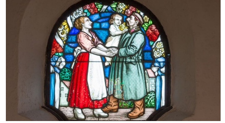
AMMERGAUER ALPEN GMBH