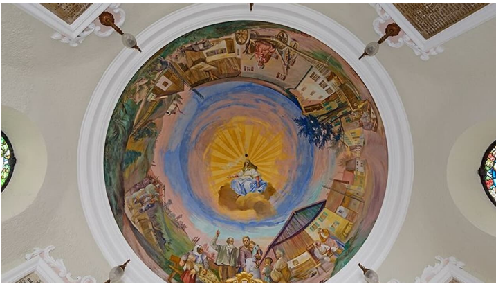
Bad Bayersoien