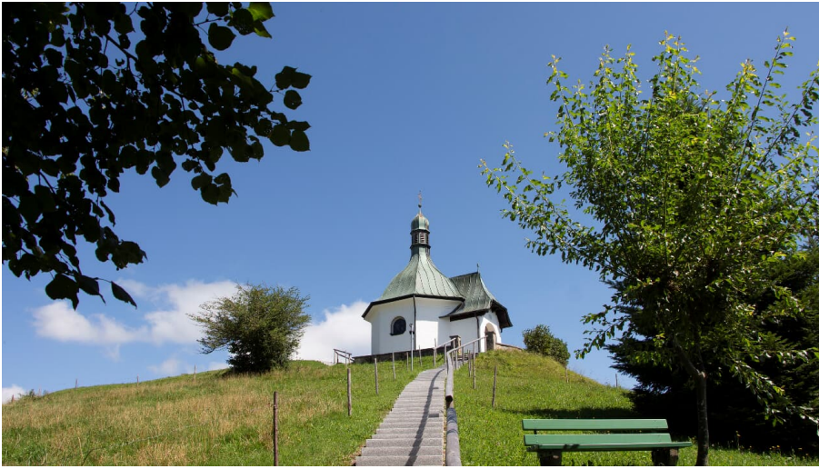
Kriegergedächtniskapelle Treppe