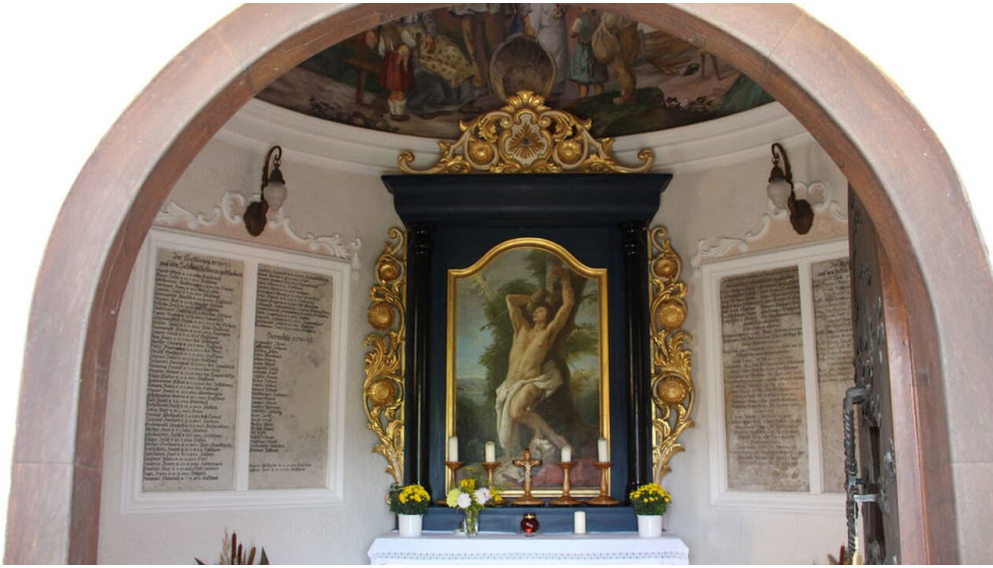
AMMERGAUER ALPEN GMBH