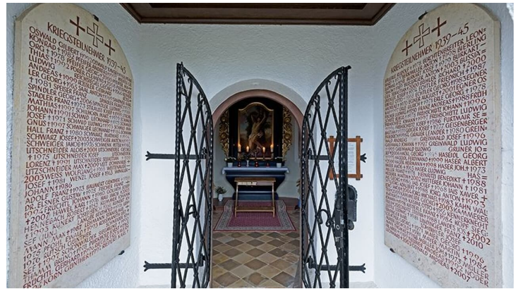
Bad Bayersoien