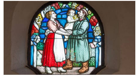
AMMERGAUER ALPEN GMBH