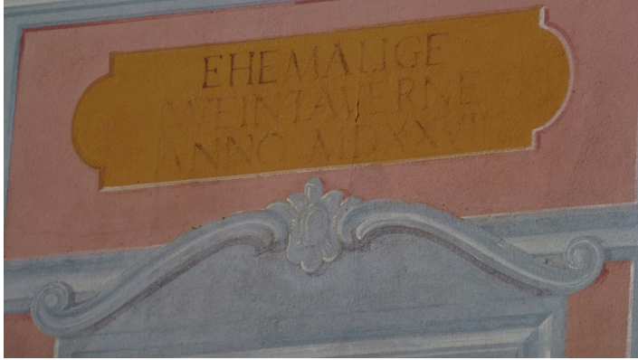
Historische Hausbeschriftung