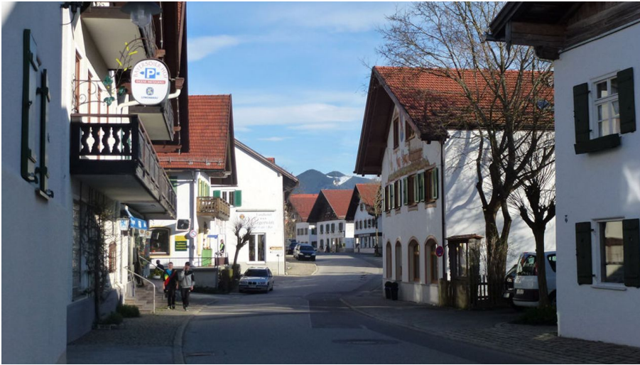
Dorfstrasse in Bad Bayersoien