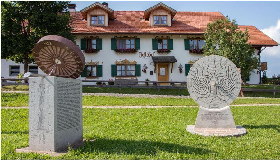
AMMERGAUER ALPEN GMBH