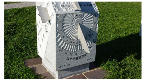
Quader - Sonnenuhr