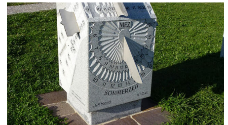
Quader - Sonnenuhr - © Uwe Reineke