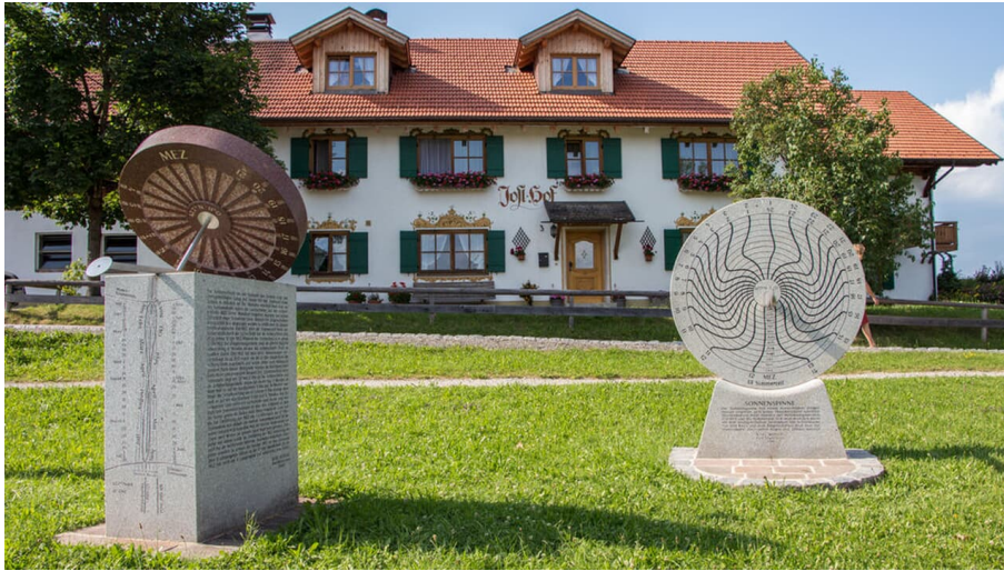
AMMERGAUER ALPEN GMBH