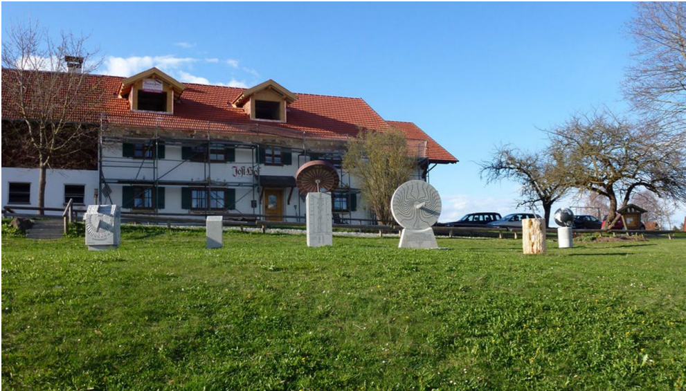
Sonnenuhren im kleinen Kurpark