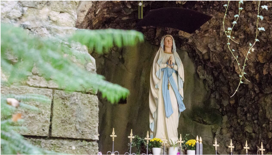
Die Lourdesgrotte