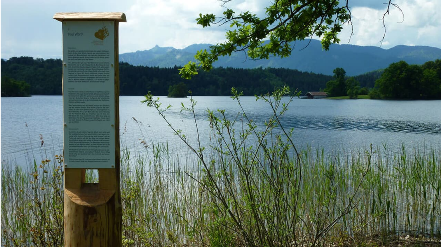
Meditationswegstele mit Blick auf die Insel Wörth