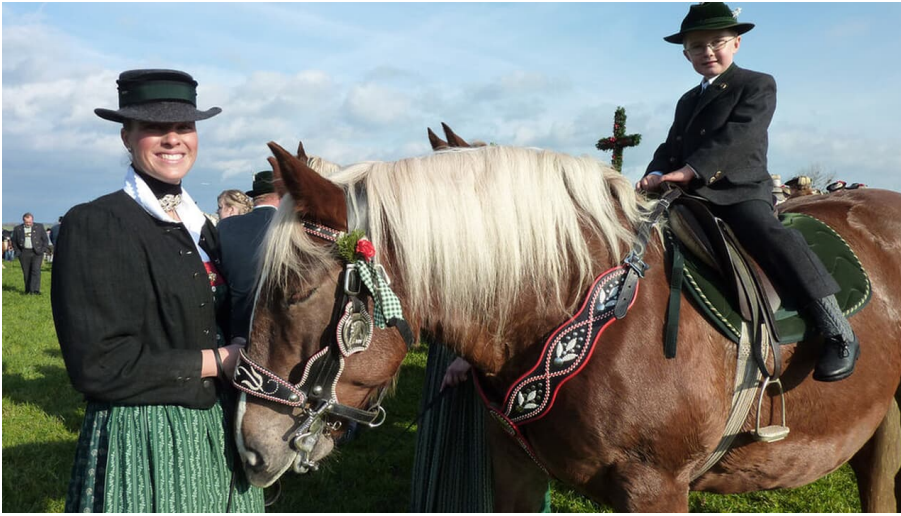
Leonhardi in Froschhausen