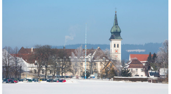
Kloster Rottenbuch im Winter