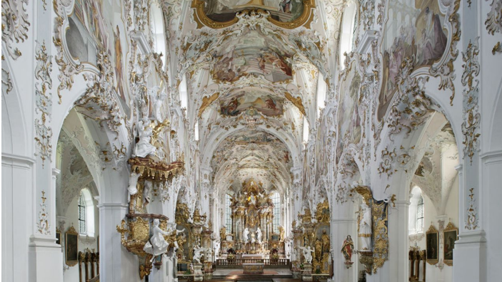
Klosterkirche Rottenbuch innen