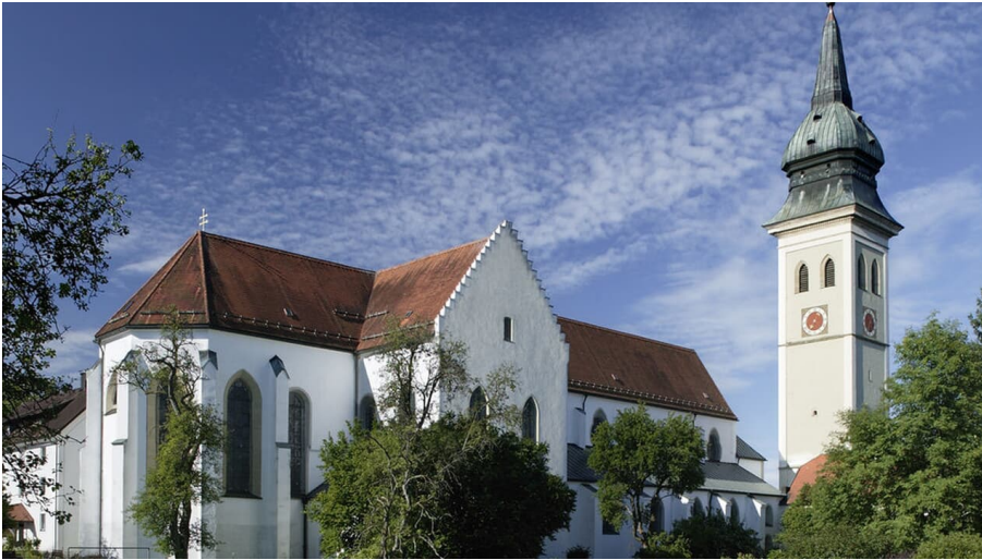
Klosterkirche Rottenbuch