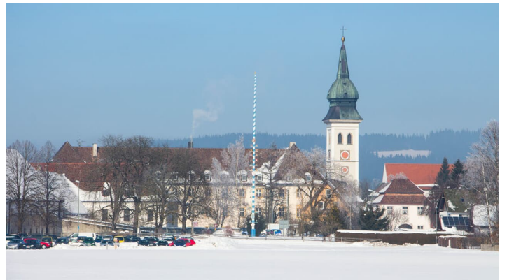
Kloster Rottenbuch im Winter